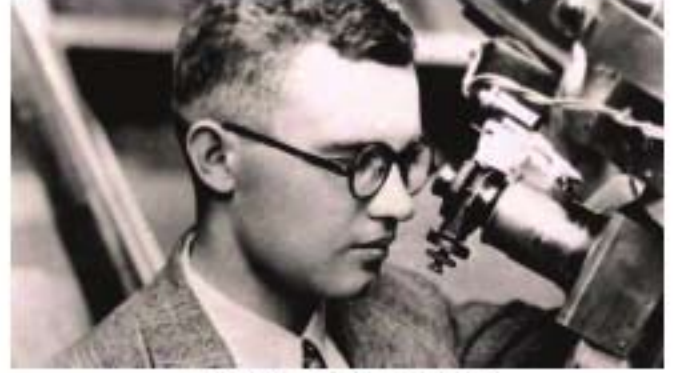
ক্লাইড টমবে প্লুটোর আবিষ্কর্তা

নিউ হরাইজেন প্লুটোর প্রথম ছবি তোলে ৪২০ কোটি কিমি দূরত্ব থেকে, ২৪ শে সেপ্টেম্বর ২০০৬। সেই ছবি প্রথম প্রকাশিত হয় ওই বছর ২৮শে নভেম্বর। নিউ হরাইজেনের অতি উচ্চ মানের ক্যামেরায় ধরা পরল বৃহস্পতি গ্রহ ও তার উপগ্রহ ক্যালিস্টোর ছবি। মেঘে ঢাকা বৃহস্পতির আবহাওয়ায়ামণ্ডল, বিদ্যুৎচমকের দৃশ্য, ৩০০ বছরেরও পুরনো একটি ঘূর্ণাবর্তের ছবি পাঠায় নিউ হরাইজেন। ঘূর্ণাবর্তটির নাম 'লিটল রেড স্পট'। এর পর চিত্রিত হয় বৃহস্পতির উপগ্রহ আইয়ো। আইয়ো এখনো সক্রিয়। বিস্ফোরিত হয় অনেক আগ্নেয়গিরি। নিউ হরাইজেন সংগ্রহ করে